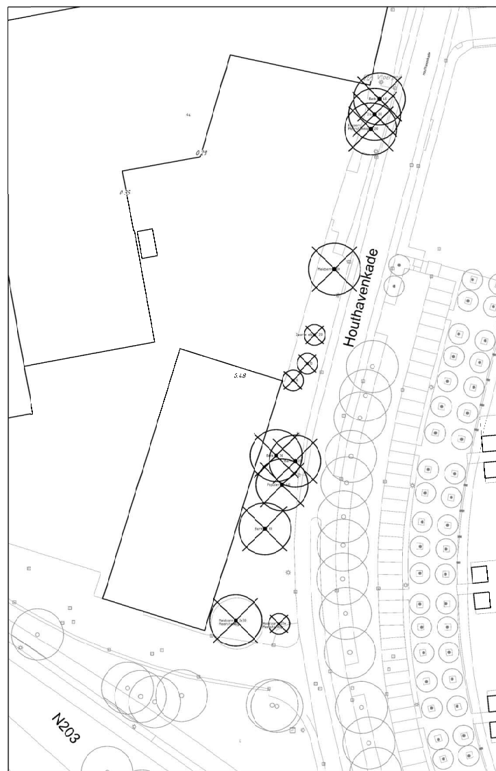
Detail B 1:500